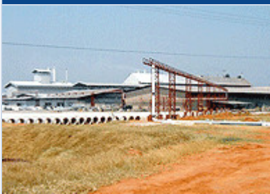
Entstehende Biogas-Pipeline mit der SWI im Hintergrund