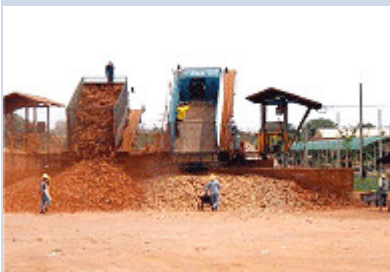
Die Maniok Wurzel ist bereit für die Verarbeitung